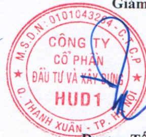
Đương Tất Khiêm