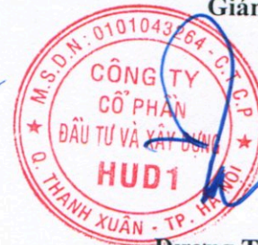
Đương Tất Khiêm