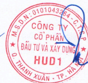
Đương Tất Khiêm